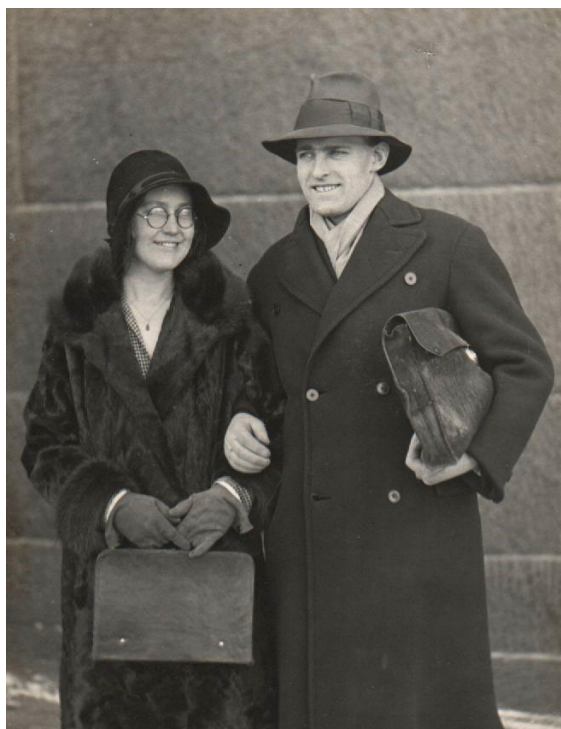
Det nye præstepar for den danske menighed i Berlin.