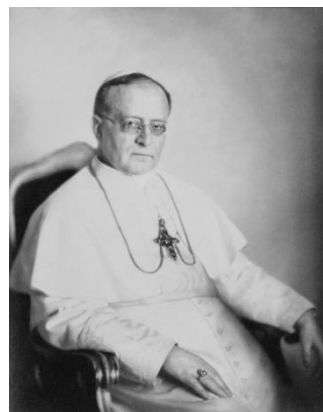
Pave Pius den 11. 1857 - 1939