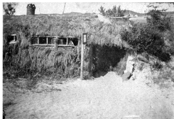
Mange har hørt om, at Taterhytten var Danmarks første vandrehjem, men er det rigtigt?

borg Kirke?]. Vi gik igen med en daarlig Smag i Munden, spiste Frokost paa Hotel Silkeborg, læste Avis som er meget opfyldt af Boretvnen alias Grønthandler Framlev. Saa spadserede vi den dejlige Tur langs Aa og Søer til Svejlbæk. Træerne betænkte sig endnu, men Skovbunden var dejlig. Saa "Taterhytten" med Drivhus og Skjoldborg-Stue og Turisthytter.