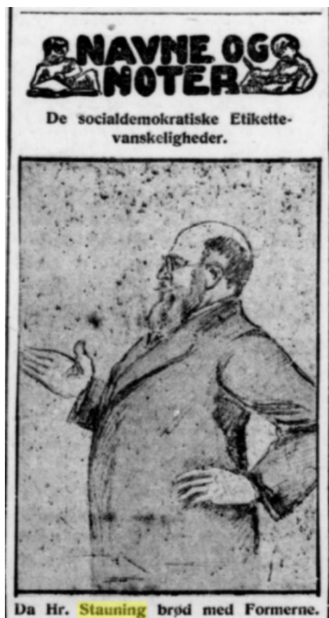
Fra Ålborg Amtstidende den 8. okt. 1924