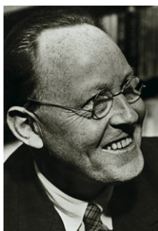
Gunnar Gunnarson/Islandsk forfatter, 1889-1975