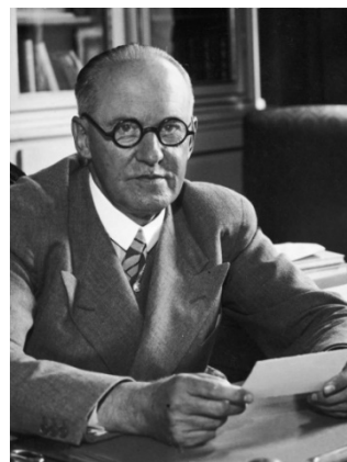
K. K. Steincke, 1880 – 1963